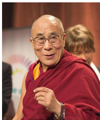
14. dalajláma Tändzin Gjamccho